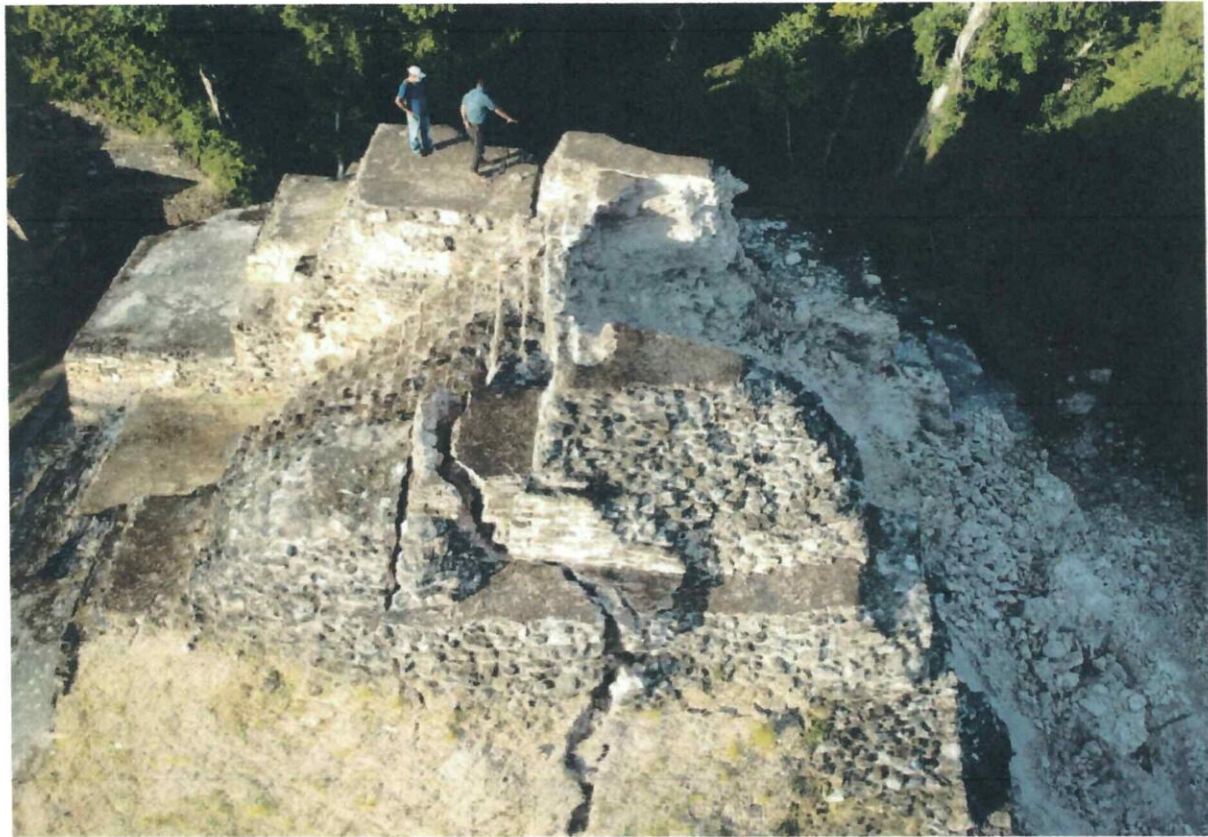
Fig. 2. Panorámica general del edificio 137 ubicado en la Plaza Norte del Sitio Arqueológico Yaxha.

Como parte de las actividades para la conservación se inició una mesa técnica para realizar la mejor ruta para la conservación del edificio 137 de la Acrópolis Norte del Sitio Arqueológico Yaxha, en la cual se expusieron diferentes criterios y la viabilidad para realizarlos. Todas las propuestas quedarán pendientes hasta obtener la interpretación de los análisis mediante la caracterización de materiales.