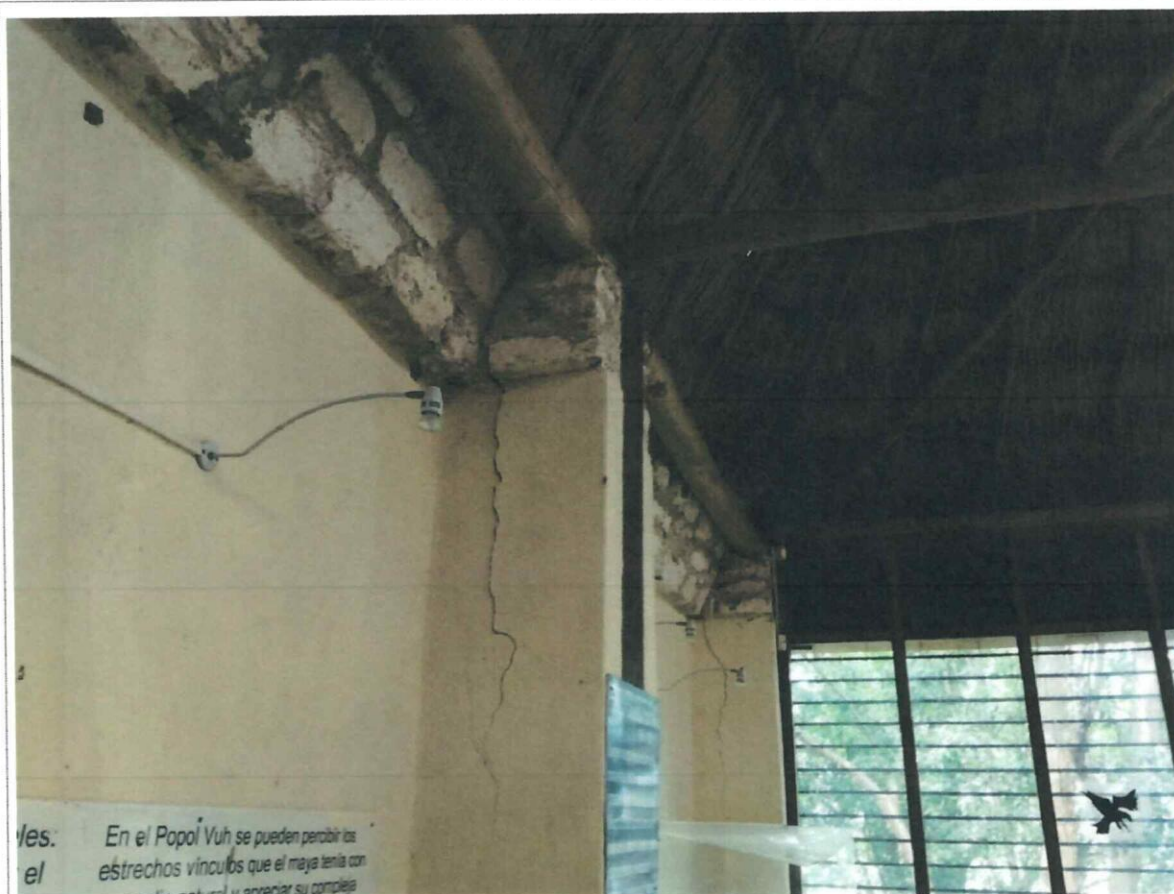
Fig. 1. Daños en cerramiento vertical y juntas de soporte en el interior del museo del Sitio Arqueológico Yaxha.

2.2 Asesoría para la propuesta del cambio de cubierta del museo del Sitio Arqueológico Yaxha Se brindó asesoría para el cambio de cubierta del museo del Sitio Arqueológico Yaxha, dentro de la cual se realizó una inspección y se determinó que debido a los daños que poseen algunas de las columnas se deberá reforzar y realizar un sondeo para verificar la eficacia de la cimentación de la construcción; además, se propuso modificar la estructura del diseño realizado y entregado en febrero de 2019; dicha modificación se basa en reducir el peso propio de la estructura para evitar daños estructurales a la estructura actual.